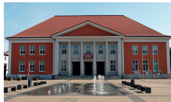
Kulturzentrum Rathenow und Märkischer Platz

Das Kulturzentrum befindet sich in der neugestalteten Stadtmitte und ist ein multifunktionaler attraktiver Kultur- und Tagungsstandort, ein Ort der Begegnung und Kommunikation und begeistert mit vielfältigen kulturellen Angeboten die Menschen der Stadt und deren Gäste. Das barrierefreie Haus hält ein attraktives, bunt gemixtes Veranstaltungsprogramm für alle Altersgruppen bereit und bietet für Tagungen und Seminare ausgezeichnete Bedingungen. Wechselnde Kunst- und Sonderausstellungen verleihen dem Kulturstandort ein ganz besonderes Flair. Das integrierte Optik Industrie Museum ermöglicht eine Zeitreise durch die deutsche optische Industrie von J. H. A. Duncker bis heute.